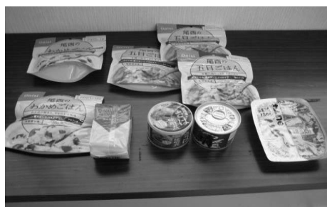
便利で味のよい物がたくさんあります。

普段は温めて食べる白ご飯をそのまま食べられるかどうかを試してみましたが、皆さん大丈夫と食べていました。