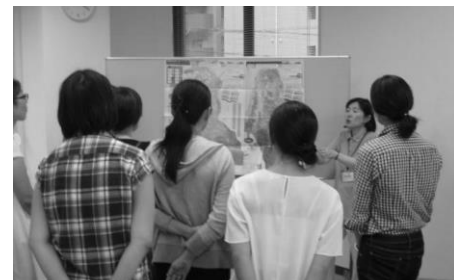
みなさん、熱心にお話を聞いています

今回、防災マップ（ハザードマップ）城南区版、早良区版を用意して、皆さんに実際見てもらいました。福岡市は、区ごとに防災マップがあり、避難所や浸水の予想区域などが載っています。詳しくは、福岡市ホームページの防災という項目から見られるようになっています。城南区版は、区役所のロビーにも置いてあります。ご自身の住んでいる周辺以外にも日頃よく行く場所やご主人の勤め先などもチェックしておくことが大事だそうです。