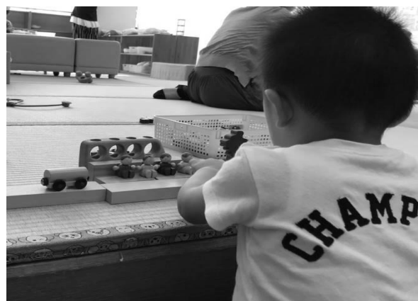
★2歳のお子さんが地下鉄を作り、その地下鉄で別のお子さんが楽しそうに遊んでいます！

子どもプラザで使っている積み木は、木目のシンプルな直方体と立方体の積み木です。高く積んだり、大きな作品を作ったりと、長い時間遊ぶためには、積み木は基尺（きじゃく）が揃っているもので、それぞれの形と大きさに共通性があるものが多いようです。