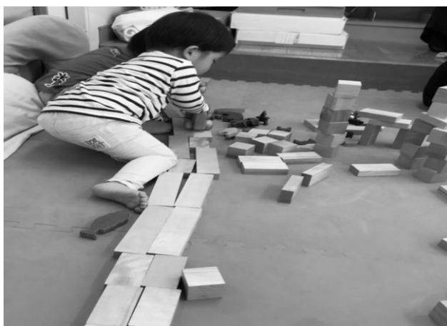
★道路に見立てた積み木の上でバスを走らせて遊んでいます！

このように、積み木は親子のふれあいのツールとなっています。また、みんな一緒に積み木で遊ぶため、お母さん同士の会話も弾み、和やかな雰囲気の中、積み木遊びを楽しまれています。