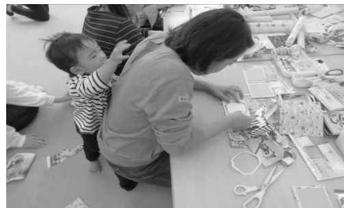
ママ♪何しているの？

「ぜひ続けて開催してほしい。」「学生さんとのおしゃべりが楽しかった。」「若い方の将来の役に立てたようで嬉しかった。」とたくさんの感想もいただきました。