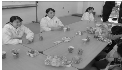
お茶とお菓子で歓談中♪