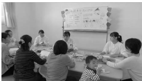
学生さんの説明に熱心に耳を傾けるママ

お母さんたちは、学生さんたちからのレクチャーを受けながら素敵な絵本を作りました。皆さん、お子さんの可愛らしい写真をもってきていたのですが、どれもこれも愛があふれる素敵な写真ばかり！大事に育てていらした子育ての軌跡を改めて感じることができました。