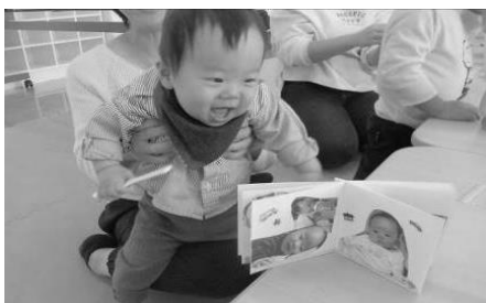
写真絵本も実物も可愛すぎます♡